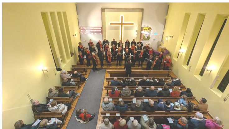
Concert de la chorale CANTALIA du 14 décembre 2025