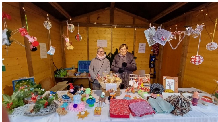
Stand de la paroisse au marché de Noël d'Ostwald