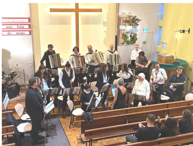
Concert des Z'accords d'Eleon du 9 novembre 2025