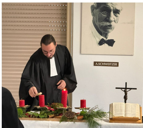
Célébration des cultes dans la salle Schweitzer en raison de la panne du chauffage de l'église. Un grand MERCI à Katja pour la réalisation de l'arrangement de l'Avent.