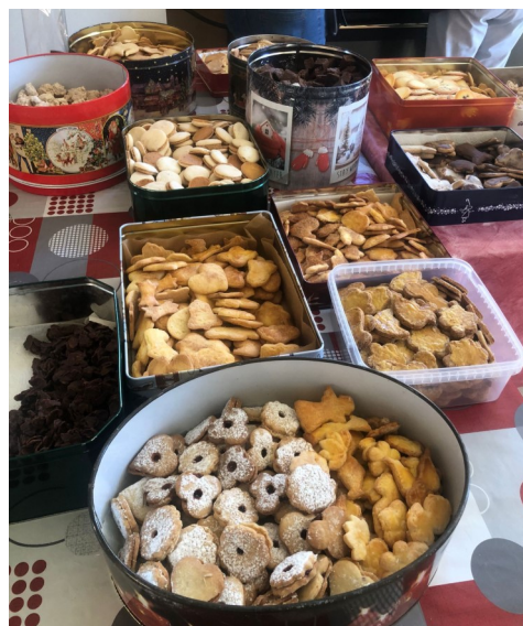
29 kg de « bredele » confectionnés (plus de 30 variétés différentes) voici le nouveau record de l'opération « bredele » de Noël. Inutile de dire que tous les sachets ont été vendus lors de la fête paroissiale et lors du marché de Noël !