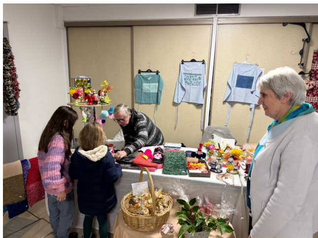
Fête paroissiale du 22 novembre 2025 : stand du club féminin