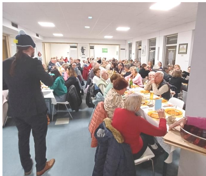
Fête paroissiale du 22 novembre 2025