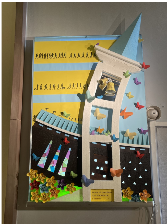
Illustration et photo réalisées par Jean WECHSLER

« Venez et marchons à la lumière de l'Éternel »