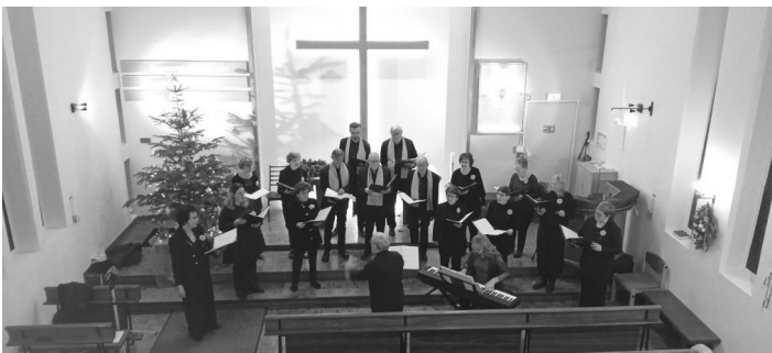
Concert de l'ensemble QUINTESSENCE le 17 décembre 2023

Comme tous les ans la fin d'année a été très active au sein de notre paroisse comme en témoignent les quelques photos prises.