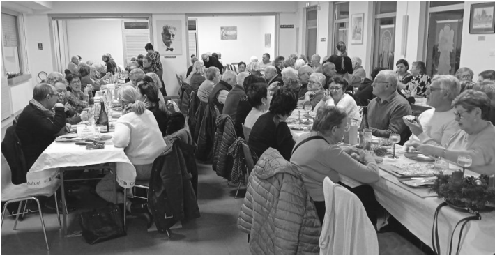
Soirée « tartes flambées » du 25 novembre 2023