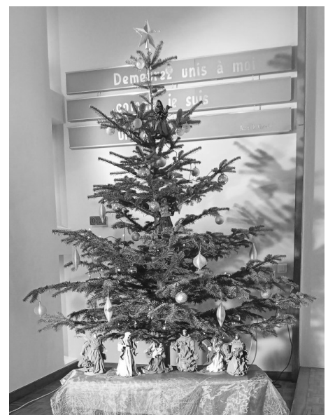
Le sapin et sa crèche

Un grand MERCI également aux paroissiens rencontrés lors de ces événements et qui apportent leur soutien à la paroisse