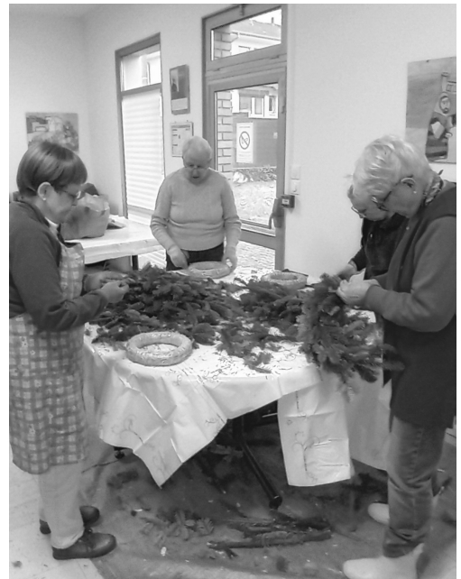
Confection des couronnes de l'Avent