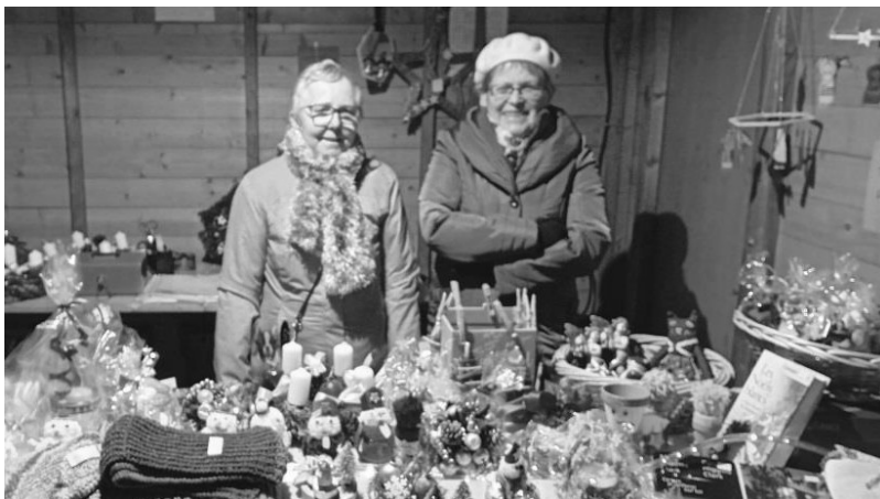
Présence lors du Marché de Noël du 1er au 3 décembre 2023